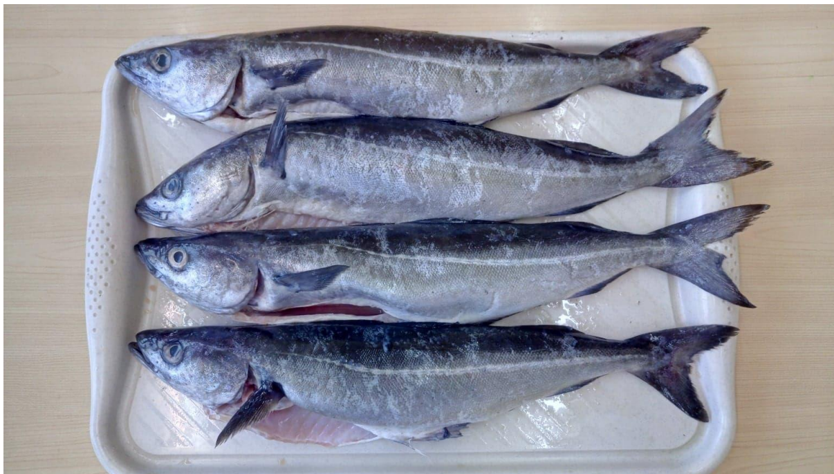
Fot. 1 Czarniak patroszony z głową ( Pollachius virens )

Po dokonaniu pomiarów morfometrycznych ryb z głową, można zaliczyć go według stosunku długości do sortymentu D (powyżej 45cm), natomiast uwzględniając masę – do sortymentu 4 (od 1kg – 2kg). Oceny sortymentów dokonano wg wytycznych nieobligatoryjnej normy PN-A-86753 Ryby i inne zwierzęta wodne. Ryby dorszowate świeże i mrożone.