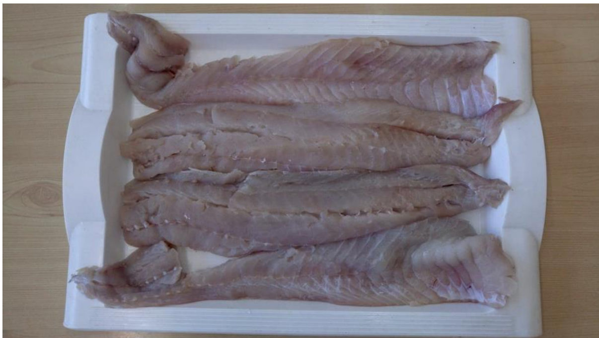
Fot. 2 Filet bez skóry z czarniaka ( Pollachius virens )