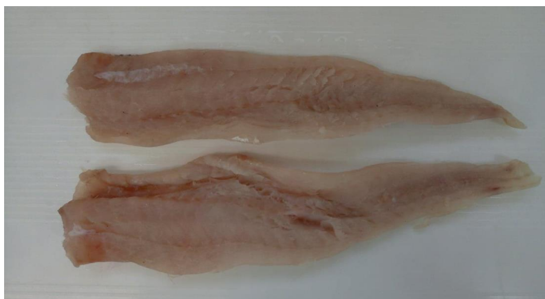
Fot. 2 Mintaj, filet bez skóry