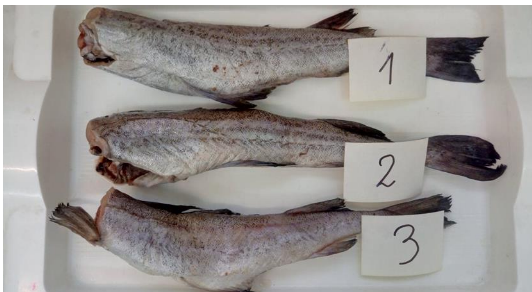
Fot. 1 Mintaj tusza

** ze względu na specyfikę produktu, nie dokonano oceny morfometrycznej. Łączna suma ścinków wyniosła 0,110kg