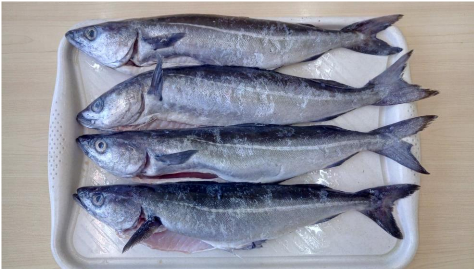
Fot. 11. Czarniak świeży

Północno-Wschodni Atlantyk. Surowiec rybny dostarczony w blokach przechowywanych w temperaturze -22 °C.