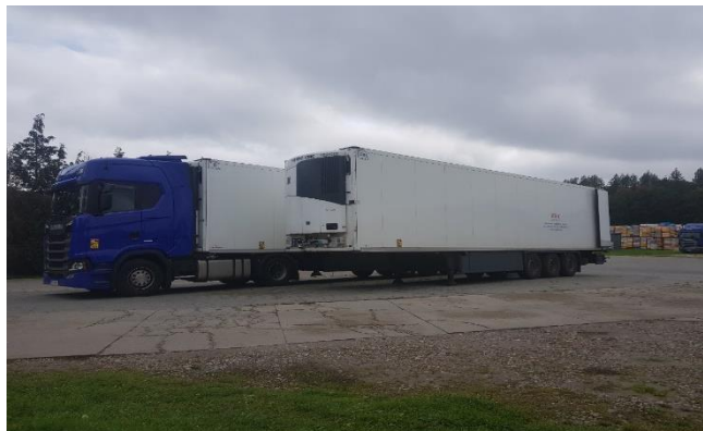
Fot.1. Samochód izotermiczny chłodniczy

Dostawa surowca rybnego odbywa się w sposób zgodny z wymaganiami dobrej praktyki produkcyjnej. W pomieszczeniu przyjmowania surowca nie ma warunków do jednoczesnego odbioru surowca świeżego i mrożonego, dlatego przyjęcia tych surowców są realizowane oddzielnie. W ramach przyjęcia surowca odbywa się wstępna ocena organoleptyczna, kontrola temperatury, masy oraz stanu opakowania. Wykwalifikowany pracownik podejmuje decyzję o przyjęciu lub zwrocie surowca. Zakład posiada własne środki transportu surowców i ich produktów w postaci samochodów ciężarowych lub dostawczych typu chłodnia (fot.1). Stan środków transportu to 6 aut i 3 naczepy.