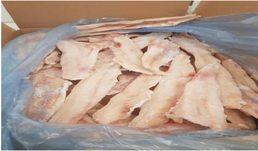
Fot. 14 Filet z mintaja bez skóry, mrożony

Opakowanie: mrożone – 5-300 kg opakowania kartonowe