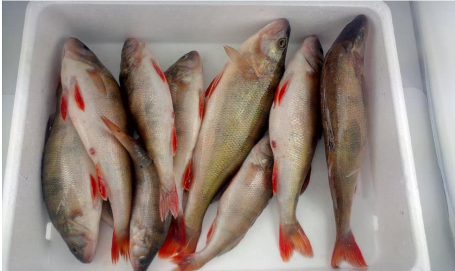
Fot. 8. Okoń świeży

Deklarowany rejon połowowy – Morze Bałtyckie 27IIIId, narzędzie połowowe – OTB włoki denne. Świeży surowiec dostarczono do zakładu w skrzynkach.