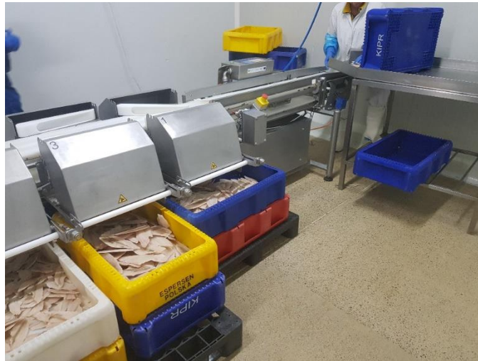
Fot. 4. Sortownica

Przed pakowaniem gotowych wyrobów następuje ich sortowanie (fot. 4). Produkty mrożone pakowane są w kartony tekturowe od 5-300 kg w zależności od zamówienia. Produkty świeże pakowane są w opakowania styropianowe po 3-5 kg. Wszystkie opakowania stosowane do żywności są nowe, przechowywane w magazynie opakowań. Opakowania pośrednie są wielokrotnego użytku, które po wykorzystaniu są myte w myjce opakowań.