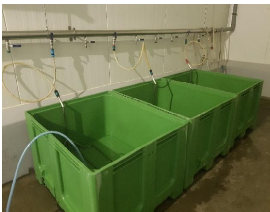
Fot. 2. Baseny do rozmrażania surowca

Do zakładu dostarczane są surowce świeże i mrożone. Rozmrażanie surowca odbywa się w pomieszczeniu „rozmrężania”. W pierwszej kolejności, następuje wstępne rozmrażanie bloków ryb w temperaturze otoczenia ok. 20 °C przez około 10 godzin. Następnie około 200kg surowca umieszczane jest w basenach z wodą do czasu uzyskania w tkance temperatury 0 °C (fot. 2). Woda w zbiornikach podlega cyrkulacji za pomocą napowietrzania.