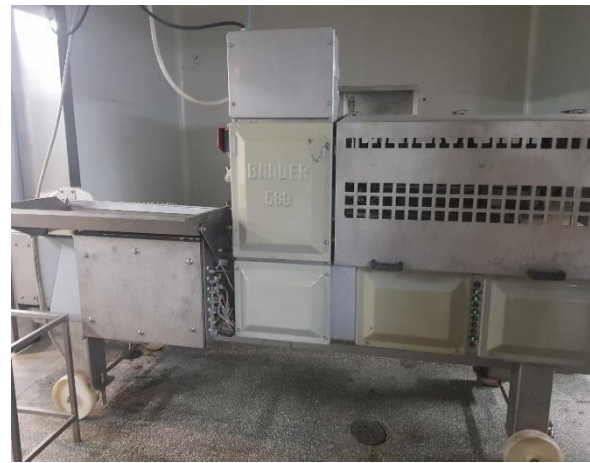
Fot. 6. Fileciarka Baader 580