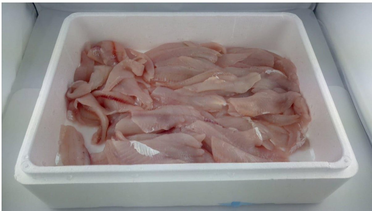
Fot. 2. Wyrób - filety z okonia, bez skóry