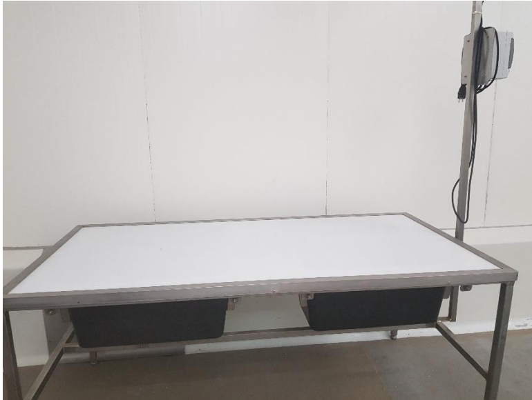
Fot. 7. Stół do wykrywania pasożytów w tkance

Ważnym elementem przy produkcji ryb dorszowatych są stoły do wykrywania pasożytów w tkance ryb (fot. 7). Zakład ZIT Sp. z o. o. Sp. K. zaopatrzony jest w tego typu urządzenia do wizualnego przeglądu filetów czarniaka i mintaja.