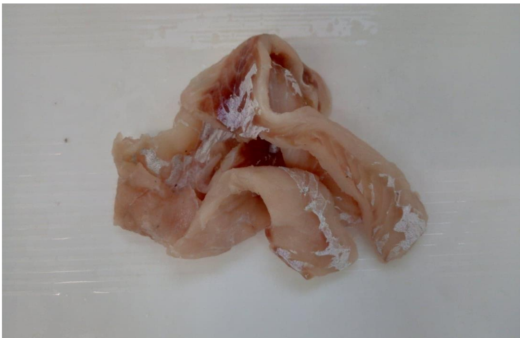
Fot. 4 Mintaj „ścinki” ogony + brzuchy