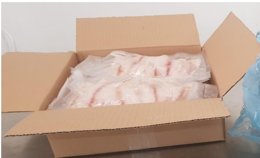
Fot. 9. Chłodzony filet bez skóry z okonia pakowane próżniowo