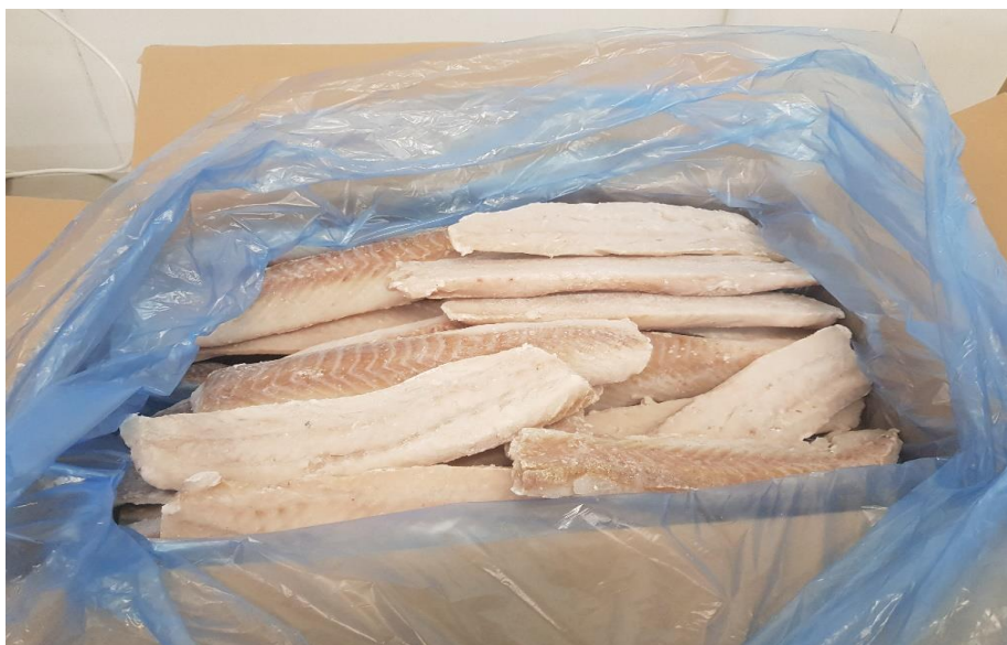
Fot. 12. Polędwica z czarniaka, mrożona