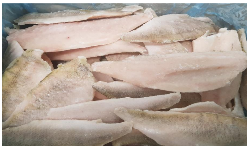
Fot. 10. Filet z okonia ze skórą, mrożony

Opakowanie - mrożone – 5-300 kg opakowania kartonowe; chłodzone – 3-5 kg opakowania typu styrobox.