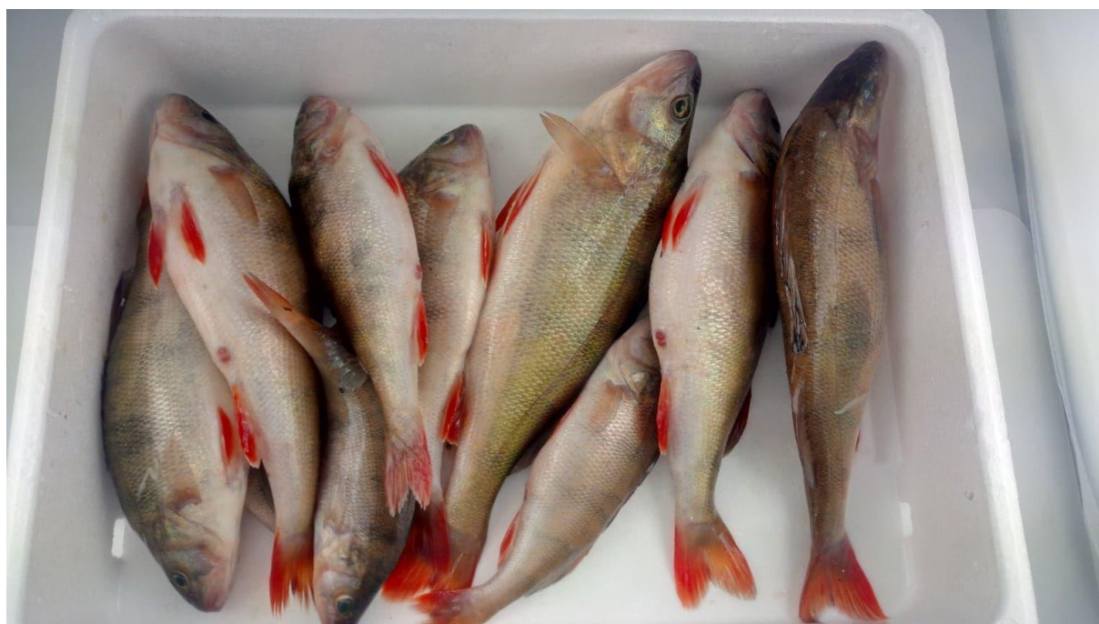
Fot. 1. Okń pospolity

Po dokonaniu pomiarów morfometrycznych próby surowca można zaliczyć go pod względem całkowitej długości i masy do sortymentu S (powyżej 0,2kg do 0,5kg).