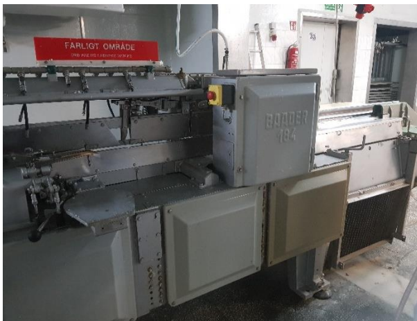
Fot. 5. Fileciarka Baader 184

Baader 184, Baader 580 (fot. 5, fot. 6) Maszyna do skórowania lub filetowania surowca rybnego. W zakładzie wykorzystywana w ramach projektu do przetwórstwa czarniaka. Wydajność przetwórcza od 52,2% do 96,5%, w zależności od zastosowanej maszyny i ilości asortymentów.