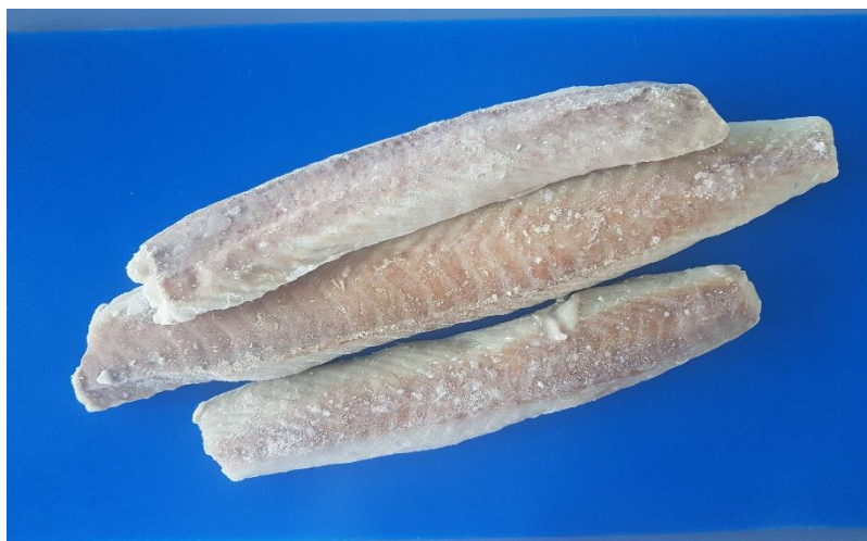
Fot. 15. Polędwica z mintaja, mrożona

Opakowanie: mrożone – 5-300 kg opakowania kartonowe