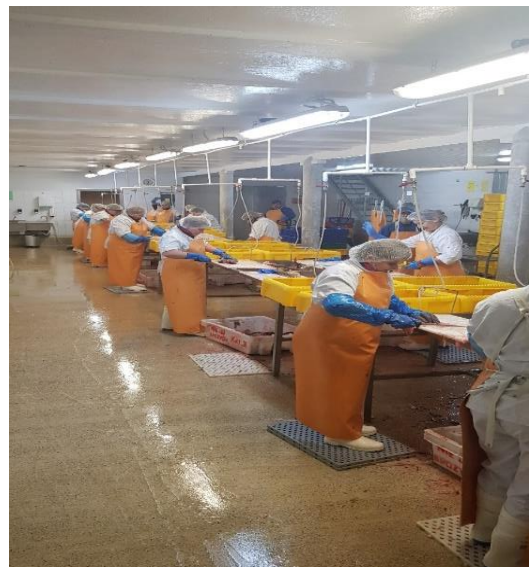
Fot.3. Proces ręcznej obróbki czarniaka

Świeże tusze z czarniaka – zakład posiada dwie maszyny do obróbki czystej tych ryb tj. Baader 184 i Baader 580. Surowiec z magazynu transportowany jest na halę obróbki wstępnej, gdzie poddany jest patroszeniu i odgławianiu a następnie jest ręcznie dostarczany do maszyn filetujących (B 184 lub B 580).