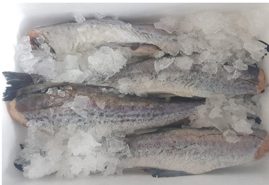
Fot. 13. Mrożone tusze z mintaja

Miejszem połowu surowca był rejon FAO 67, Północny Atlantyk. Surowiec rybny dostarczono w blokach przechowywanych w temperaturze -22 °C. Datę przydatności do spożycia określono do 15.02.2022 roku. Firma ZIT Sp. z o.o. Sp. K. deklaruje, że w ramach realizowanego projektu dostarczono i przerobiono 41 600 kg mrożonej tuszy z mintaja (fot. 13).