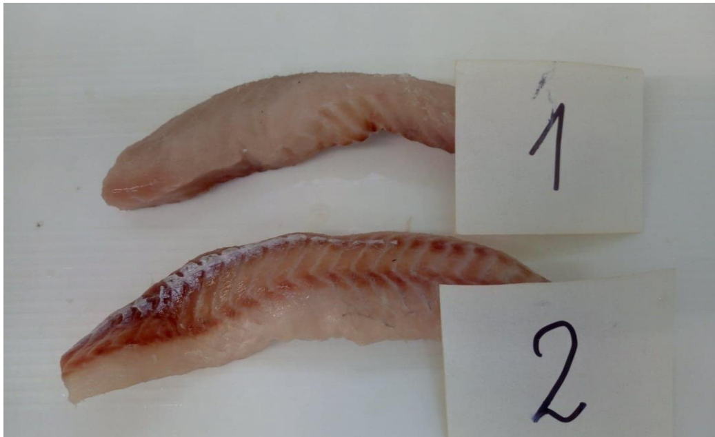
Fot. 3 Mintaj połędwica